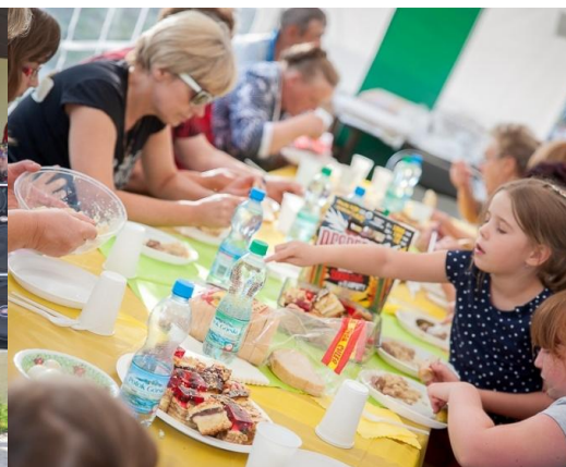
•organizacja spotkania integracyjnego