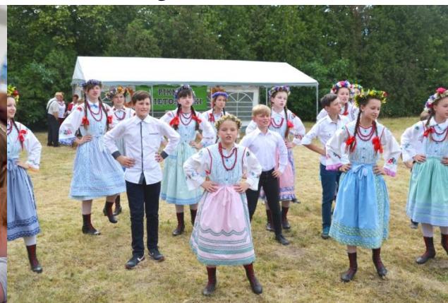
•organizacja Pikniku Świętojańskiego