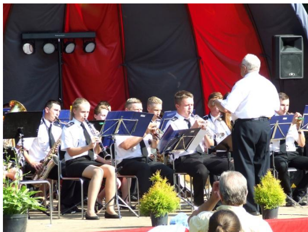
•zakup instrumentów muzycznych