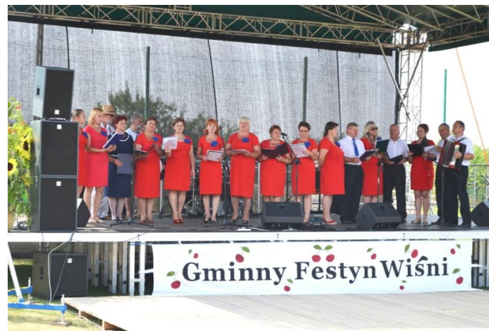
•organizacja Festynu Wiśni