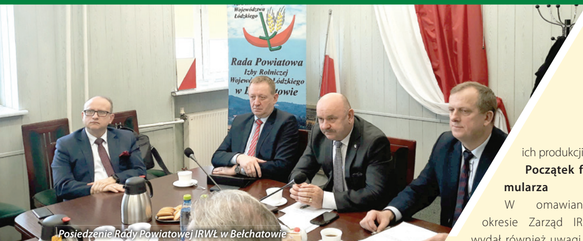
Posiedzenie Rady Powiatowej IRWŁ w Bełchatowie