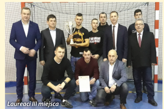
Laureaci III miejsca

Towarzystwo Ubezpieczeń Wzajemnych „TUW” w Łodzi, Oddział Regionalny ARiMR w Łodzi Biuro Kontroli na Miejscu, Kasę Rolniczego Ubezpieczenia Społecznego, Starostwo Powiatowe w Skierniewicach, Radę Powiatową IRWŁ Powiatu Rawskiego, Radę Powiatową IRWŁ Powiatu Skierniewickiego, Austria Juice, Związek Sadowników RP Oddz. Biała Rawska.