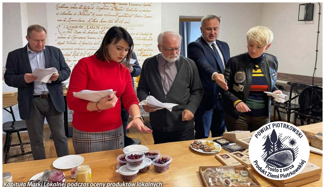
Kapituła Marki Lokalnej podczas oceny produktów lokalnych

Lecz i to samorząd powiatu zmienił, przy pełnej aprobacie pszczelarzy – członków Regionalnego Związku Pszczelarzy Ziemi Piotrkowskiej. W Wolborzu w 2020 roku, uruchomiono Inkubator Przetwórstwa Lokalnego Miodów i Produktów Pszczelich Ziemi Piotrkowskiej.