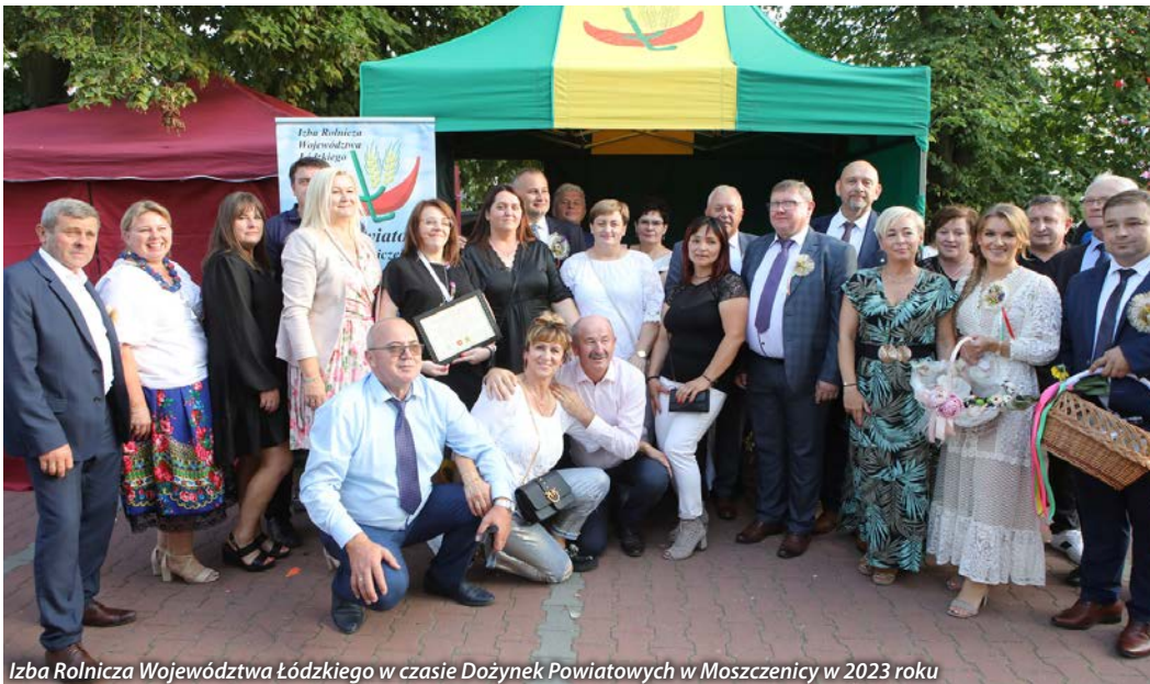
Izba Rolnicza Województwa Łódzkiego w czasie Dożynek Powiatowych w Moszczenicy w 2023 roku

A to za sprawą ponad 14. tysięcy gospodarstw, w których rolnicy, przez cały rok wraz z rodzinami, dbają o to, aby w naszych domach był chleb, mleko, mięso, warzywa i owoce. Wśród społeczeństwa ziemi piotrkowskiej zauważalna jest zwiększona świadomość, że od tego, jakiej jakości powinny być produkty, z których przyrządzamy codzienne posiłki, zależy nasze zdrowie. Te najlepsze, bo uprawiane i hodowane, w zgodzie z naturą, bez ulepszczy smaku, mamy na wyciągnięcie ręki – u naszych rolników.